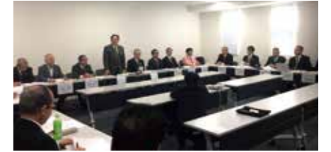
▲12月10日 次期ガバナー補佐研修会の様子