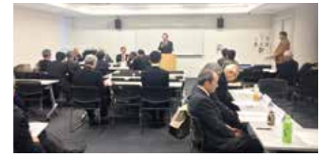
▲12月10日 ガバナー補佐・部門長会議の様子