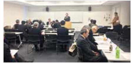
▲12月10日 ガバナー補佐・部門長会議の様子