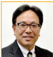
国際ロータリー第 2720 地区 2016～17 年度 ガバナー