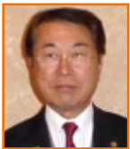
江上 公信 宇佐八幡 RC