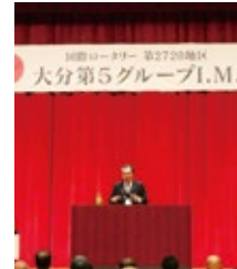
▲2月12日 大分第5G IM の様子