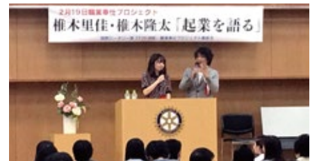
▲2月18日 熊本第5グループIMの様子