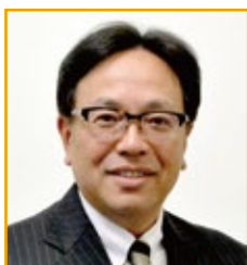
国際ロータリー第 2720 地区 2016～17 年度 ガバナー