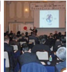
▲2月18日 熊本第5G IM の様子